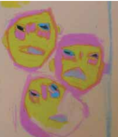
Udsnit af Jakob Kjelberg maleri. Uden titel