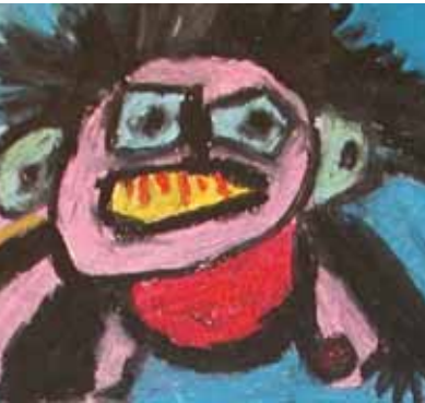
Udsnit af Jakob Kjøldberg's "Fantasidyr"

”Skaderne skal altid tænkes ind i det billede, familien stadig har af personen. For det er en helt anden person de får hjem. Nogen gange svarer det fuldstændig til, at du lukker øjnene og peger på en mand i mængden, og ham tager du så med hjem. Det er den problemstilling står med. Og han ligner jo godt nok, for de er jo dygtige lægerne til at lappe dem sammen. Men det er også kun det ydre der ligner.”