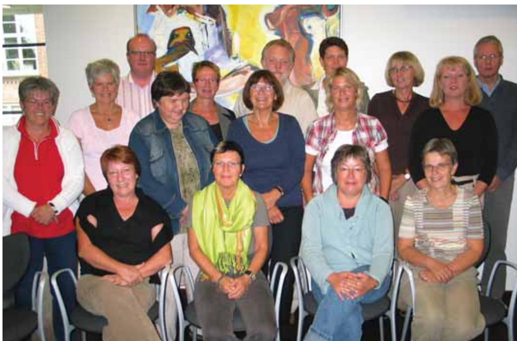
Møde i VidensTeamet august 2007

Konsulent Handicapsekretariatet Aalborg kommune