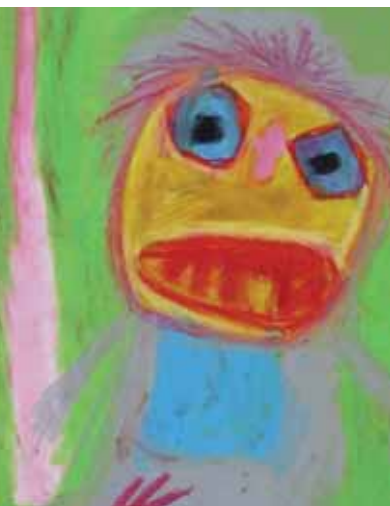
Udsnit af Jakob Kjeldberg's "Det hilsende folk"

og uddeler gule og røde kort. Man kan i det tilfælde lave et analogt system, hvor personalet i bestemte situationer udnævnes til 'dommere' med ret til at uddele henstillinger eller gule/røde kort. Målet for den adfærdsterapeutiske indsats kunne så være at minimere eller helt undgå tildelingen af gule og røde kort."