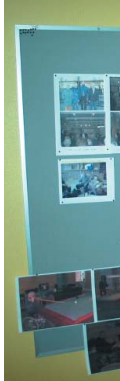
Opslagstavlen med billeder af hv

Kontaktoplysninger: Kingstrup Fredehjemsvej 2 5591 Gelsted Tlf. 64 492 492 www.fyns-amt.dk