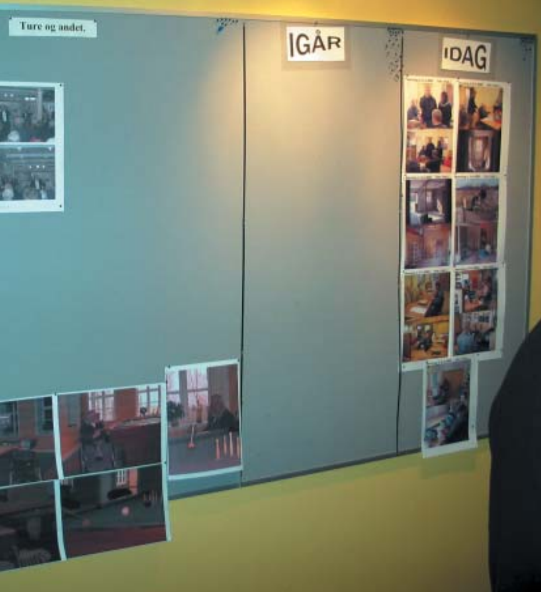
Verdagen på Kingstrup hjælper beboerne med at huske og skabe overblik.

al omgang, betyder, at der kan opstå mange konflikter både mellem personalet og beboerne og beboerne imellem. Derfor er der blevet formuleret en konfliktpolitik, der bl.a. går ud på, at der tales åbent om konflikter, at der sættes ord på, hvad der er konflikter, og hvad der ikke er - og at der skal tages ved lære af dem. Der vil uundgåeligt opstå »pædagogiske konflikter, fordi medarbejderne ikke altid lige ved, hvad de skal stille op, el-