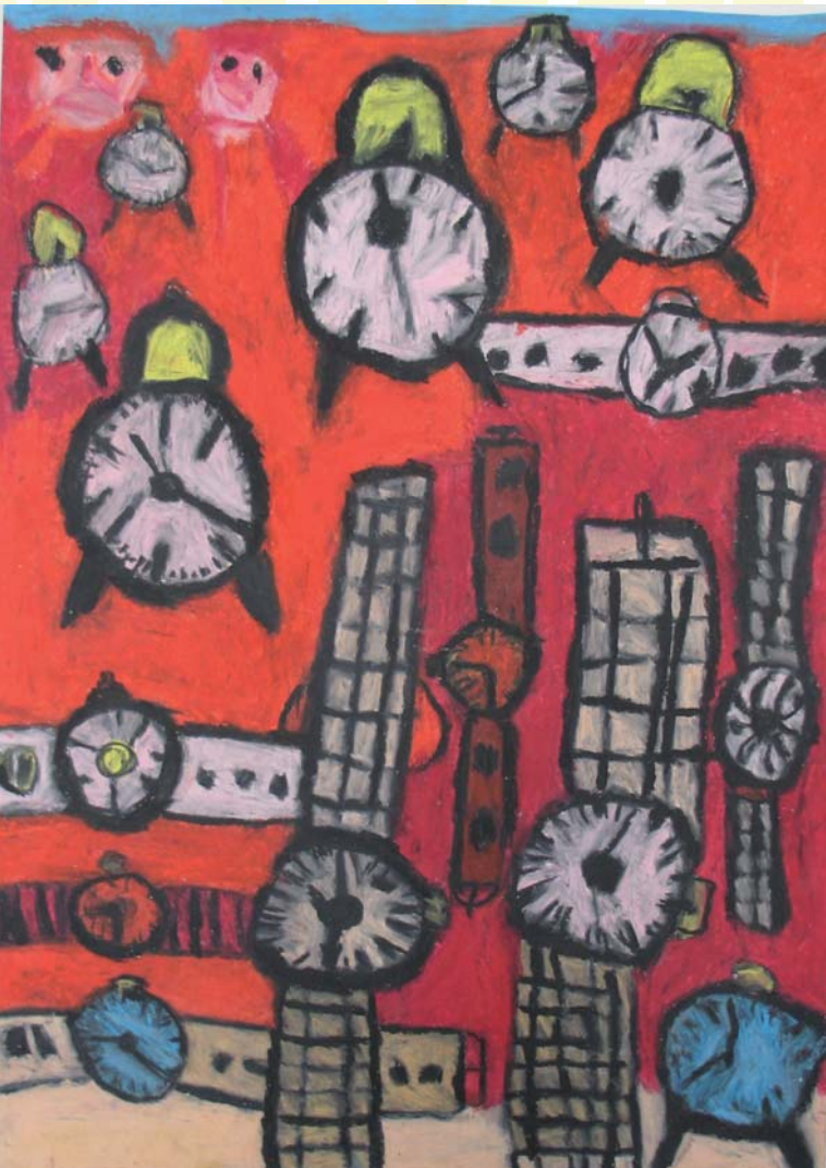
»Tiden«, Jacob Kjeldberg, Landsbyen Sølund

topledelse, som havde det samme format som ham. For der er en markant forskel i de bagvedliggende intentioner på de to reformer. Bank-Mikkelsens forestilling om forandring tog udgangspunkt i det menneskelige aspekt, og ville først derefter tage fat i strukturen. Det modsatte gælder hans efterfølgere. De har særligt i de sidste år været mere