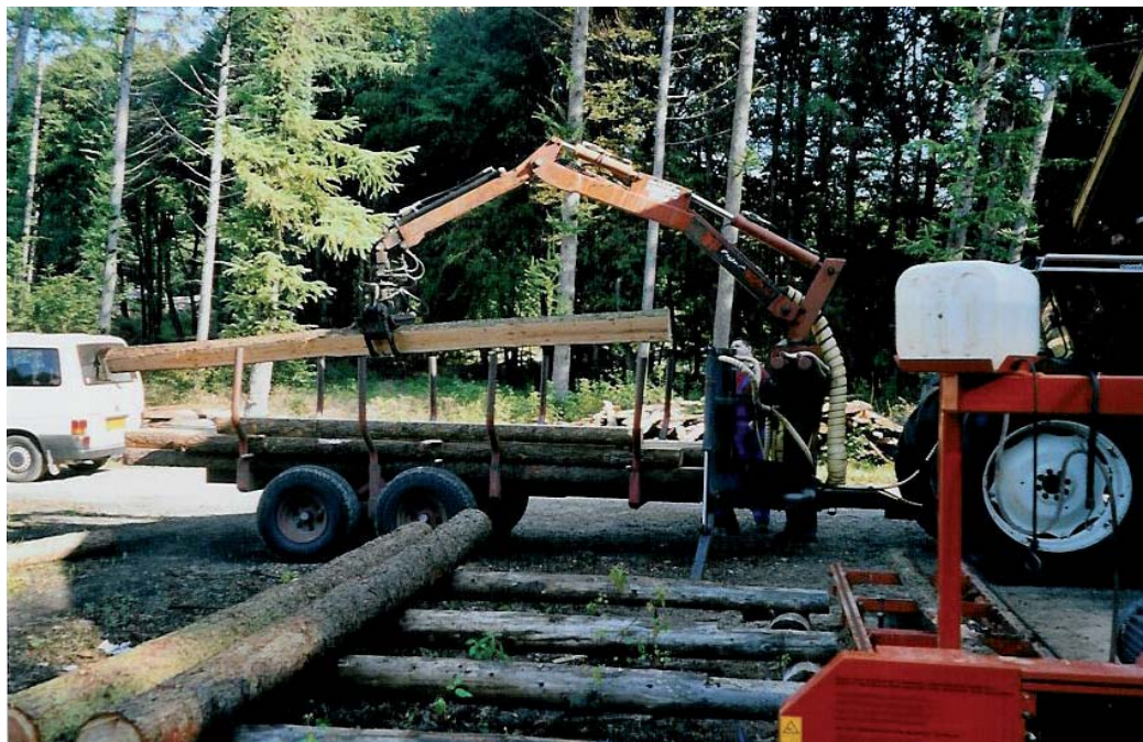
Bøgens skovvirksomhed er dagbeskæftigelse for flere af beboerne

Når man bevæger sig i nutidens samfund forventes det, at selv børn hele tiden laver tilvalg. At de vælger det, der er bedst for dem selv, og er ansvarlige for deres eget liv.